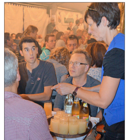
Für die Helfer im Zelt und in der Küche ist das Fest Knochenarbeit. Über die vier Winzerfesttage sind rund 250 Helfer eingeteilt.