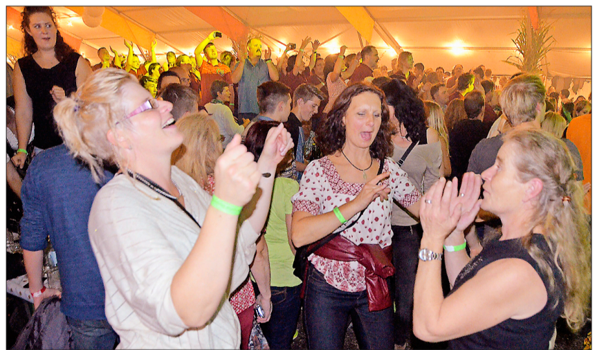
Vor der Bühne wurde ausgelassen getanzt.