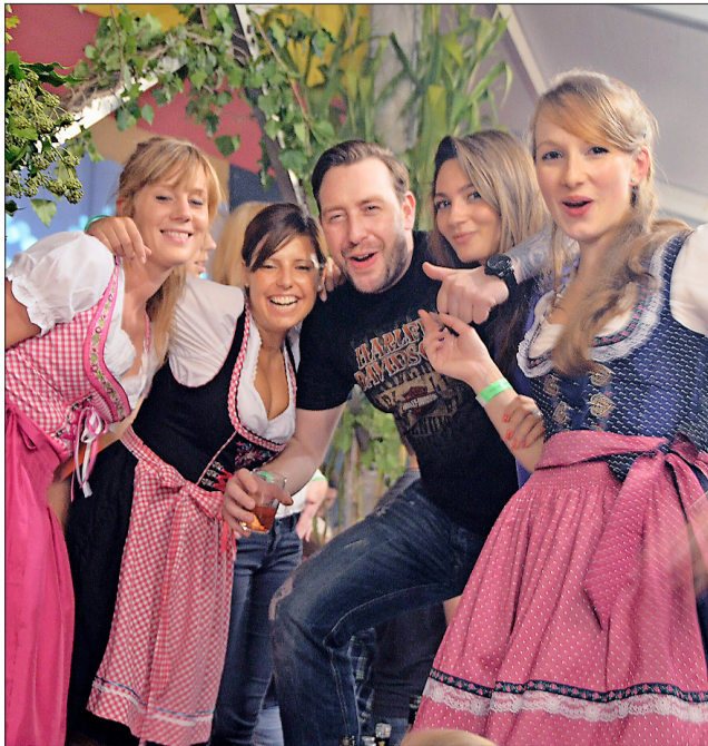
Traditionsgemäß erlebte das Winzerfest Efringen-Kirchen am Samstag seinen Höhepunkt – das Festzelt war proppenvoll.

kräfte bereits im Anfangsstadium erstickt werden“, so die Polizei. Einige Platzverweise mussten noch erteilt werden, welche allerdings jeweils befolgt wurden, ergänzt die Polizei, ohne konkreter zu werden. Zudem wurden zwei junge Männer im Umfeld der Veranstaltung dabei beobachtet, wie sie sich auf offener Straße eine kleinere Menge Cannabis zusteckten. „Das Betäubungsmittel wurde von Amts wegen aus dem Verkehr gezogen.“ Ruhig war es aus polizeilicher Sicht auch am Winzerfestfreitag. „Die Polizei war an dem Abend fast arbeitslos.“ vl